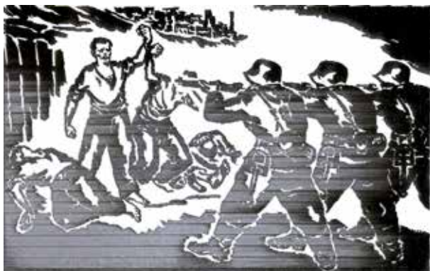
Jugoslovenska grafika 1900–1950. Katalog izložbe, Beograd, decembar 1977 – februar 1978, Beograd, 1977, katalog br. 12.