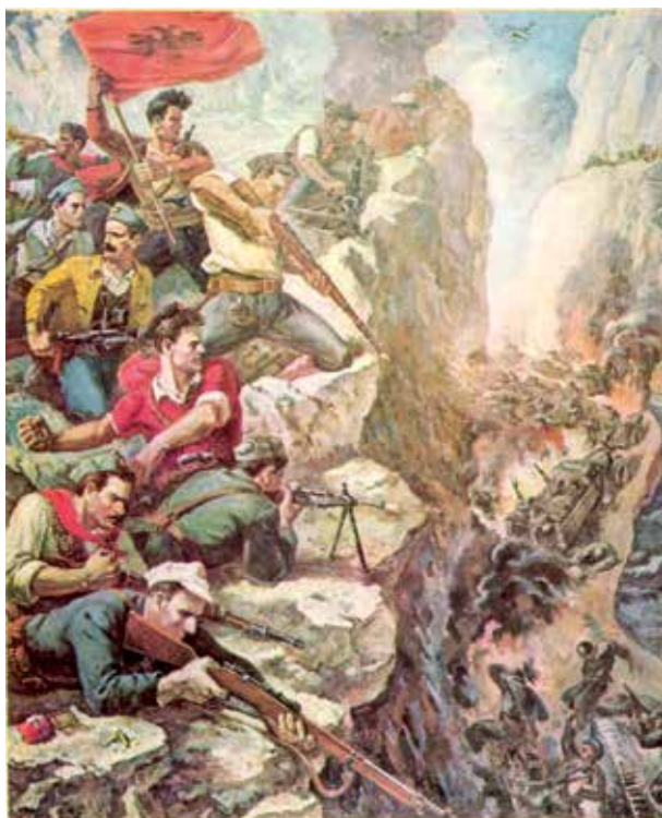
Epopeja e Luftës Antifashiste Nacionalçlirimtare e Popullit Shqiptar, 1939–1944.

► Sl. 63 - Slika Guri Madija, koja pokazuje partizanski napad na njemačku vojnu jedinicu