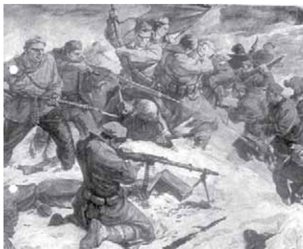
Epopeja e Luftës Antifashiste Nacionalçlirimtare e Popullit Shqiptar, 1939–1944.

► Sl. 64 - Slika Fatos Hadžiua, koja pokazuje epizodu sa bojnog polja u Drugom svjetskom ratu