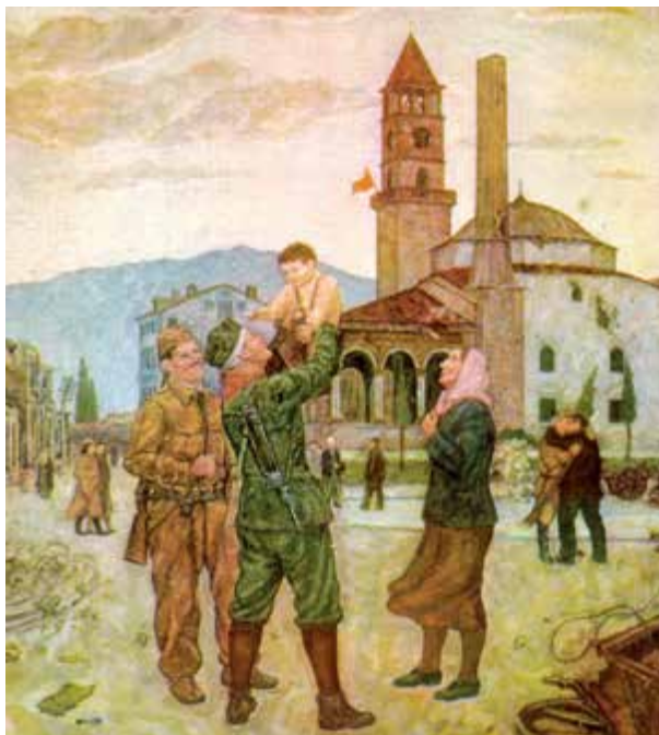
Епопеја е Luftës Antifashiste Nacionalçlirimtare e Popullit Shqiptar, 1939-1944.