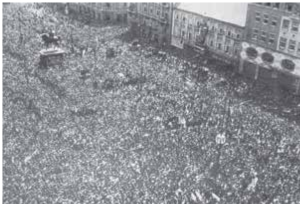
Галерия на Държавните архиви, Загреб