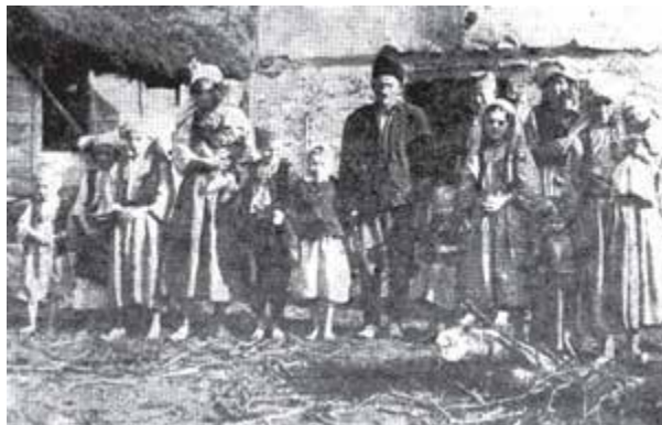
Milošević, Izbeglice i preseljenici, pr. 246.