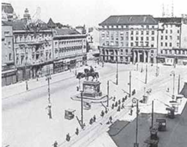
Музей на град Загреб