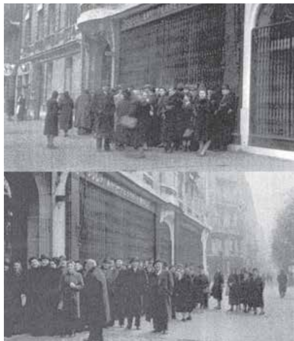
The Jews of the Ottoman Empire and the Turkish Republic.

► И 47. Турски евреи, стоящи пред генералното консулство на Турция в Париж, за да получат паспорти и визи, които да им позволят да се върнат в Турция (1943 г.)