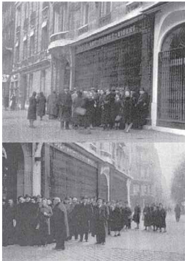
Jevreji iz Osmanske imperije i Turske republike