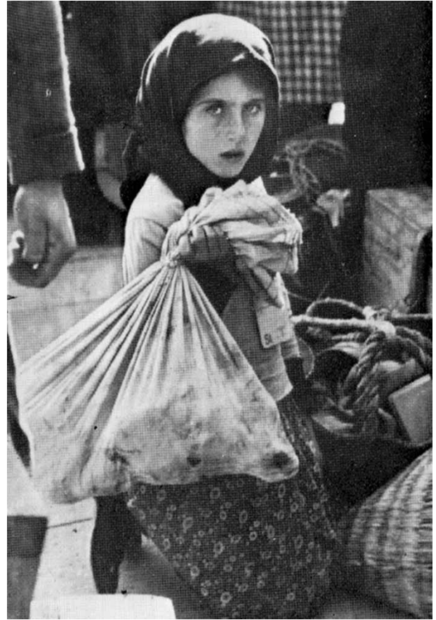
► Εικ. 42. Άγνωστο κορίτσι περιμένει την εκτόπισή του κοντά στο Τσέλιε της Σλοβενίας

Προσπαθείστε να αξιολογήσετε τη συμπεριφορά της Ρεγγίνας. Εσείς τι θα κάνατε, αν βρισκόσασταν στη θέση της; Ήταν εύκολη η απόφαση που πήρε; Τι σας λέει αυτή η μαρτυρία σχετικά με την ικανότητα αντίστασης του ανθρώπινου πνεύματος ακόμη και όταν περιβάλλεται από ένα πολύ καταπιεστικό καθεστώς;