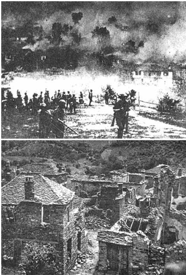
Εικ. 35. Φωτογραφίες καμένων και κατεστραμμένων χωριών (αντίποινα)