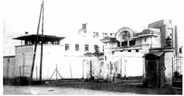
Τα εγκλήματα των φασιστών κατακτητών, σ. 211.