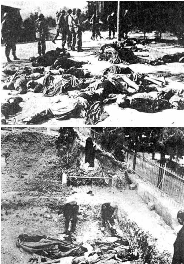
Φλάισερ, τ. Α', σ. 347.