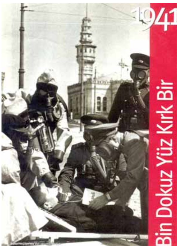
Cumhuriyet Ansiklopedisi, том 2 (1941–1960)