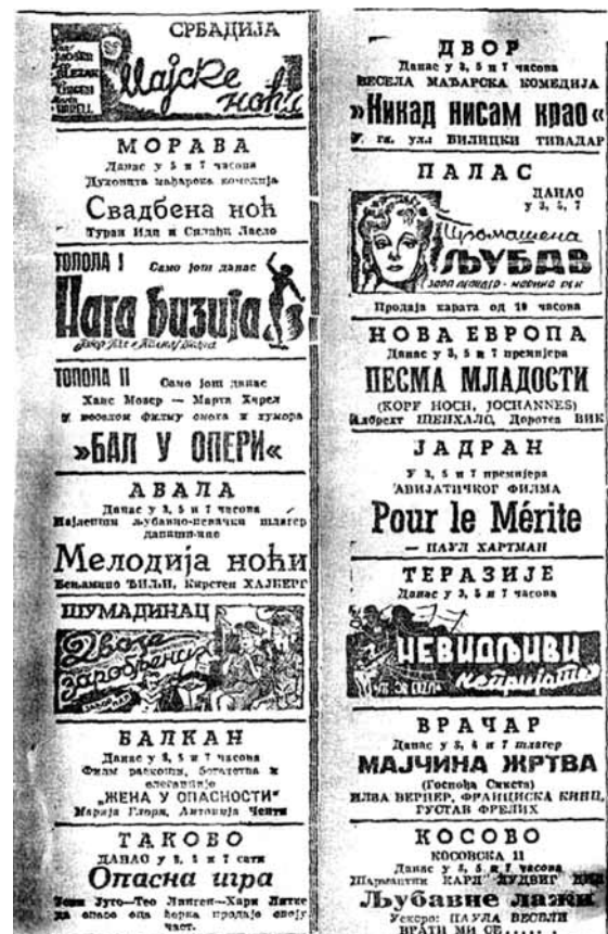
„Ново време“, Београд, 16. септембар 1942

► Сл. 28. Најава филмског програма у београдским биоскопима средином септембра 1942.