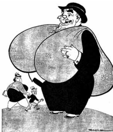
TOMBUL TEYZE YURGUNCU KARŞISINDA: Tombul Teyzenin kocası – Nefise bakma kancığım, onun torbaları seninki gibi Allah vergisi değil.

Karikatur, 24 Eylül 1942 (Söğütan Akşere Arşivi)