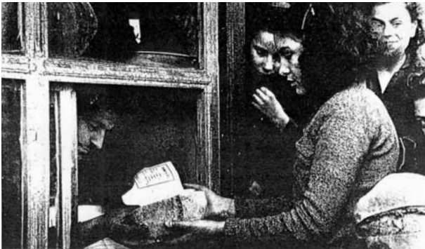
Cumhuriyet Ansiklopedisi, том 2 (1941–1960)

🔑 У Истанбулу је ограничавање потрошње хлеба почело 14. јануара 1942. У мају је за особе изнад седам година дневно следовање износило 150 г по особи.