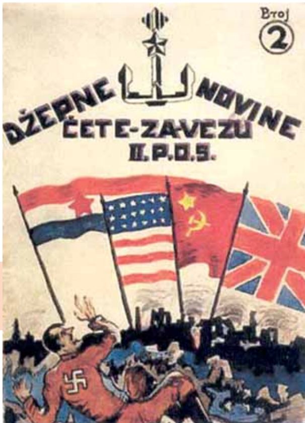
Хрватски историјски музеј

► Сл. 21. Партизанске новине: Цепне новине чете за везу, Задар (Хрватска), 1944.