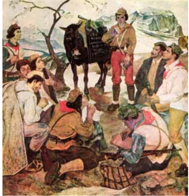
Epopeja e Luftës Antifashiste Nacionalçlirimtare e Popullit Sqiptar, 1939–1944.

Ова слика од С. Капоа носи назив Партизанска школа . Занимљива је јер илуструје образовну улогу партизанског рата. Они који умеју да читају и пишу подучавају оне који то не умеју.