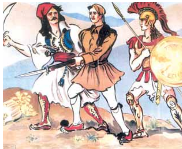
IEEE, To epos tou '40. Laiki Eikonografia, 167

► Сл. 19. Литографија која представља древног ратника из битке код Маратона, борца из грчког рата за независност 1821. и „евзонеа“ (модерног грчког борца)