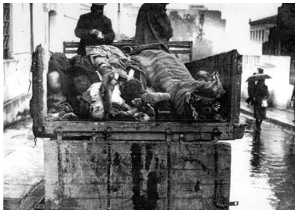
Атина, Национални историјски музеј (Istoria, том 16, стр. 59)

Готово потпуна несташница хране, посебно у Атини и другим великим градовима, довела је до тога да огромна већина становништва буде драматично неухрањена и да сваког дана мноштво људи умре од глади.