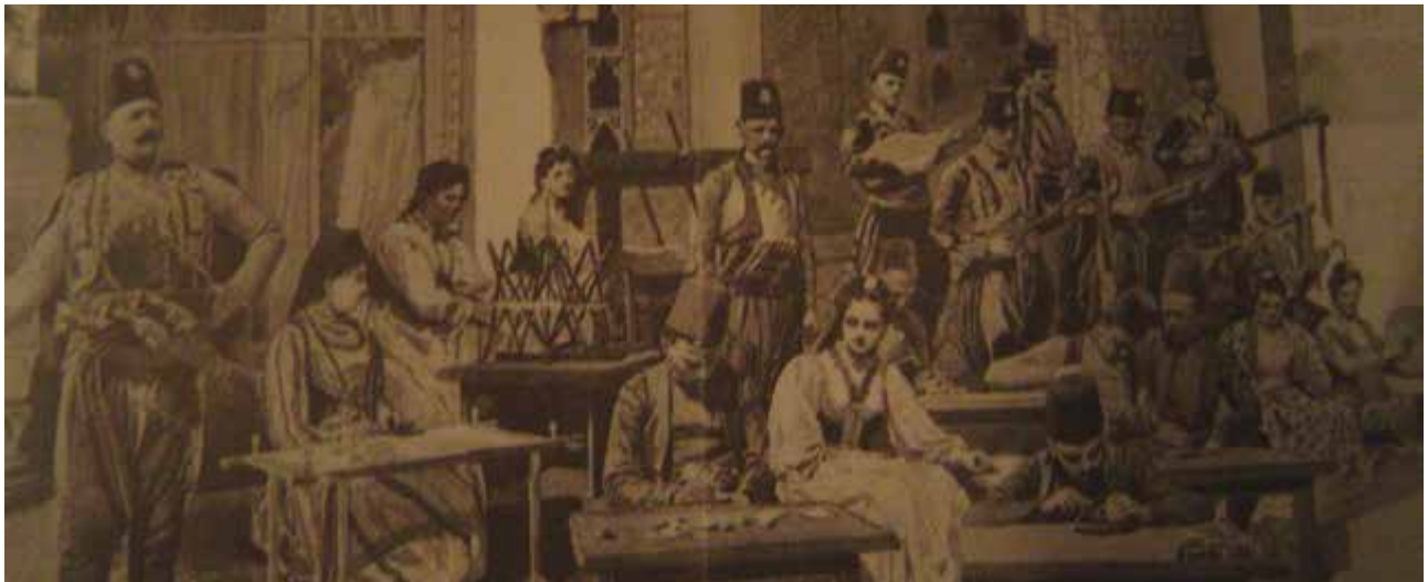
Bennett, p. 30.