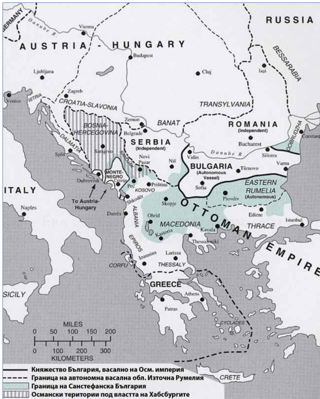
Карта 2: „Берлинските“ Балкани, юли 1878 г.