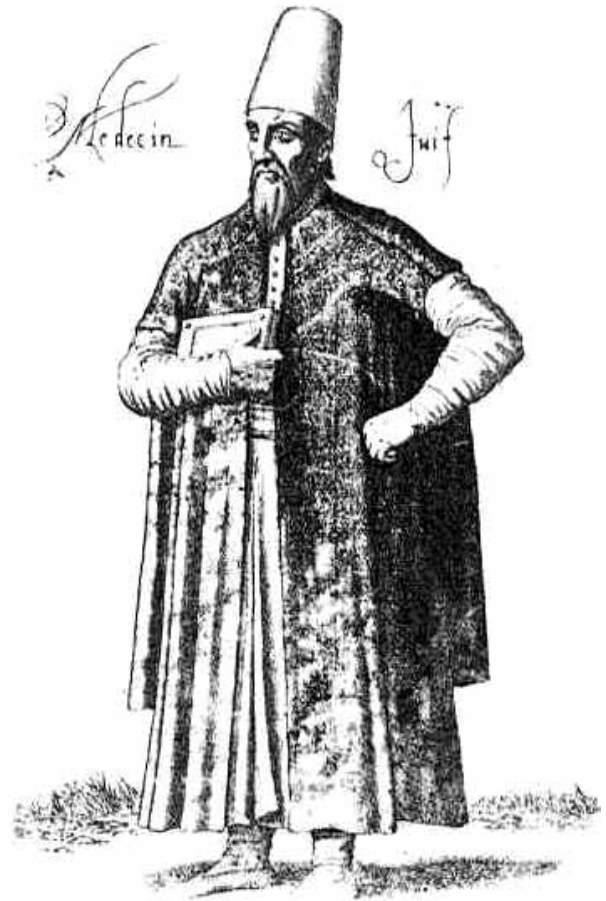
► Εικ. 20. Εβραίος γιατρός σε γαλλικό χαρακτηριστικό (1568)

3 Ποια ήταν τα κίνητρα του Σαμπατάι Ζεβί; Πίστευε στα αλήθεια ότι ήταν Μεσσίας; Να σχολιάσετε το τέλος της «σταδιοδρομίας» του· γιατί ασπάστηκε τον ισλαμισμό; Γιατί οι Εβραίοι ακολούθησαν τον Σαμπατάι Ζεβί; Πρόκειται για μία κίνηση που χαρακτηρίζει μόνο τους Εβραίους; Γνωρίζετε άλλα παρόμοια μεσσιανικά κινήματα από την ιστορία της χώρας σας; Σχολιάστε τον τρόπο με τον οποίο χειρίστηκε ο σουλτάνος την περίπτωση του Σαμπατάι Ζεβί; Ποιος ήταν ο σκοπός του; Νομίζετε ότι τον πέτυχε;