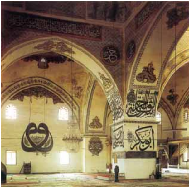
Hegy, Zimanyi, εικ. 90.