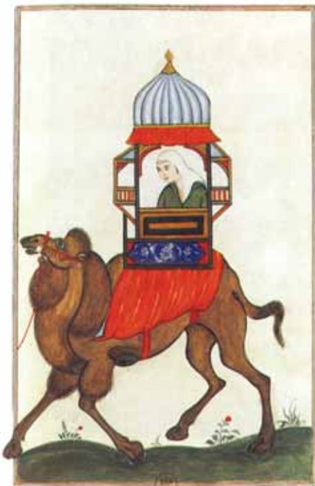
Hegy, Zimanyi, εικ. 62.