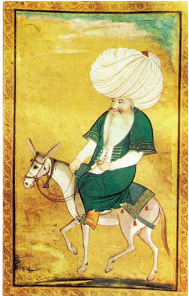
Hegy, Zimanyi, εικ. 75.

❗ Γνωρίζετε ιστορίες με τον Νασρεντίν Χότζα; Πώς παριστάνεται σε αυτά τα ανέκδοτα; Πόσο δημοφιλείς είναι οι ιστορίες με τον Νασρεντίν Χότζα στη χώρα σας; Πότε δημοσιεύτηκαν για πρώτη φορά οι ιστορίες του στη γλώσσα σας; Ρωτήστε τους φίλους ή την οικογένειά σας τι γνωρίζουν για τον Νασρεντίν Χότζα.