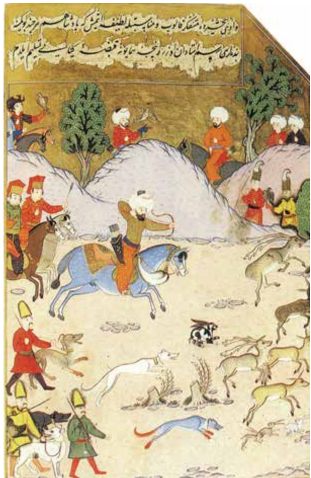
Hegy, Zimanyi, colour ill. 38.