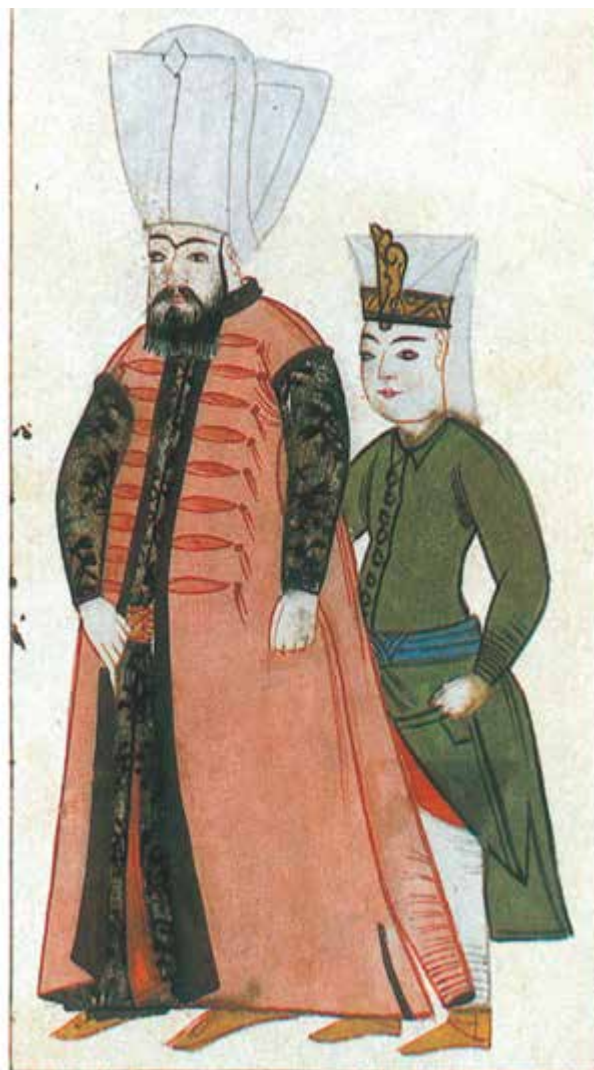
Hegyi, Zimanyi, colour ill. 43