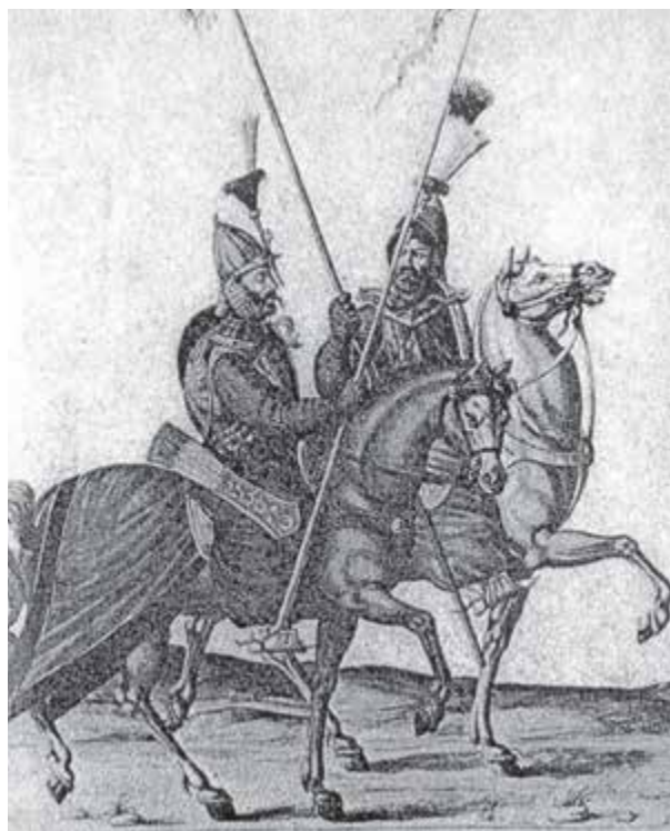
İnalçık 1973, ill. 25.