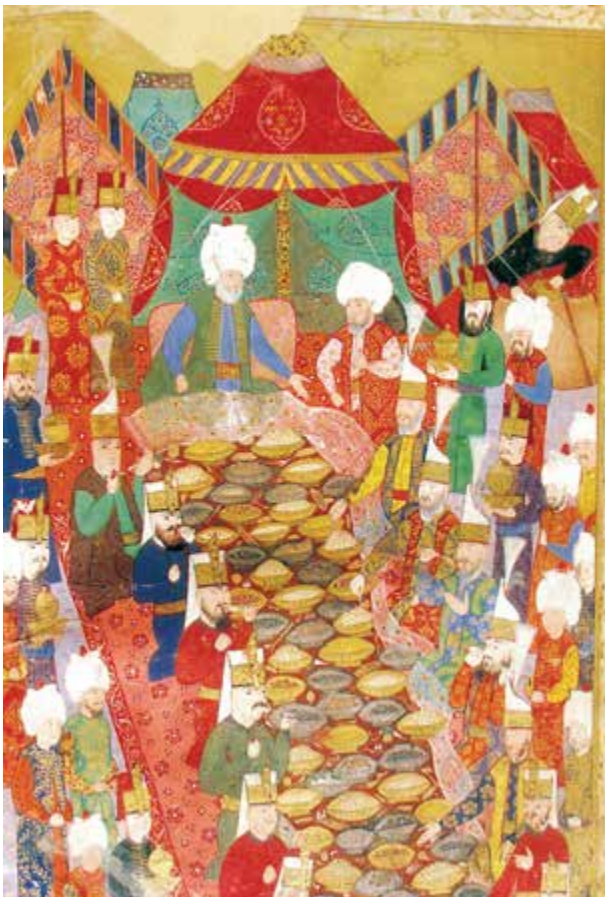
Hegy, Zimanyi, colour ill. 40.