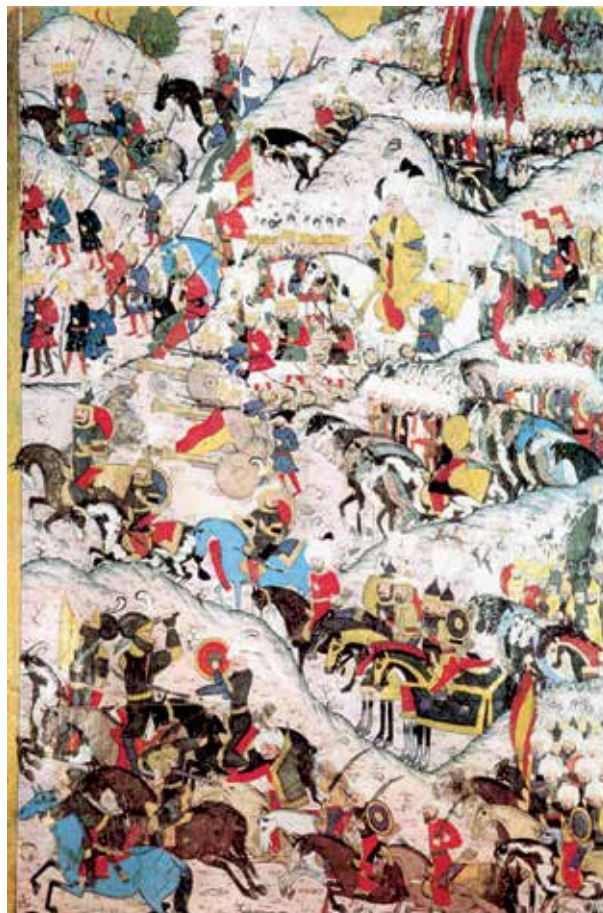
Lewis, str. 285