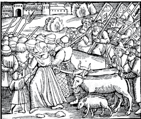
Samardžić, str. 128–129

❓ Da li slika odražava kako su se zarobljenici osjećali? Opiši ukratko situaciju prikazanu na slici. Uporedi svoj tekst sa tekstom I-11.